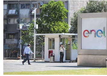
Enel va a la justicia para