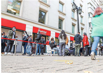
Super de Pensiones